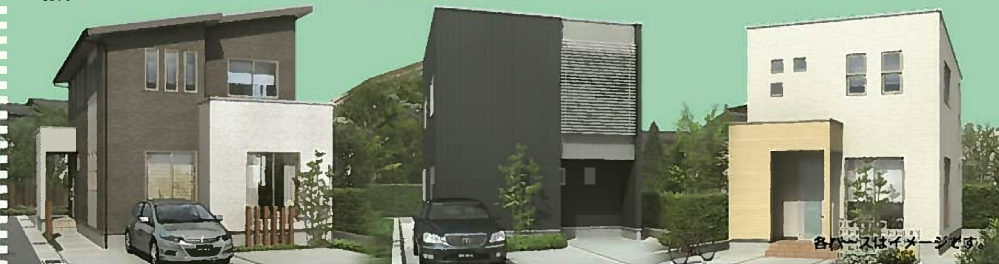
各パースはイメージです。

■カーナビをご利用のお客様は、 「富山市秋吉208番」とご入力下さい。 ※機種によって表示されない場合があります。