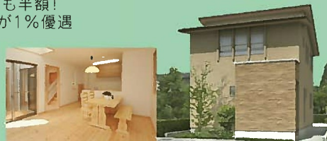
※外観パース・内観写真はイメージです。

●所在地/富山市秋吉78街区1-2 ●地目/田 ●用途地域/第一種中高層専用地域 ●建ぺい率/60% ●容積率/200% ●道路幅/西側16m・東側5.4m ●交通/秋吉バス停徒歩4分 ●電気/北陸電力 ●上水道/公共上下水道 ●負担金/上水道加入金78,750円・下水道受益負担金419円/m 2 ●売主/(株)カネコ ●確認申請番号/H23 富建セ000567 ●入居予定年月/H23年10月 ●土地は分譲前のため多少異なる場合があります。