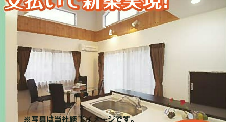
※写真は当社施工イメージです。